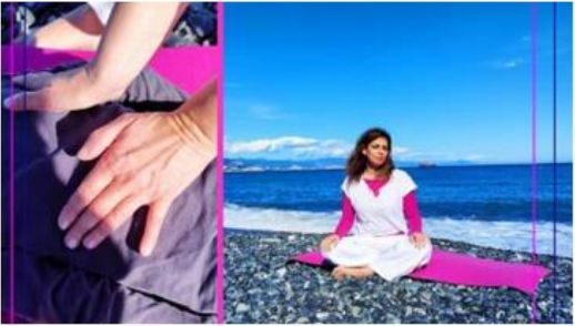
Shiatsu e stretching dei meridiani